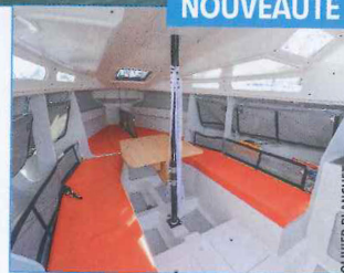
▲ Le maître bau imposant dégage beaucoup de volume sous le pont.

CE NOUVEAU Django 8S Performance – une série plus débridée que la formule Race, également proposée au catalogue mais tenue par la jauge IRC – s'est directement inspiré de la carène du 7.70. Une bonne base de départ puisque ce plan Rolland avait été, rappelez-vous, élu Voilier de l'année en 2011. Au près, bien porté par des entrées d'eau fines et un large maître bau flanqué d'un bouchain finissant en pente douce au niveau du brion d'étrave, le Django ne demande pas son reste. Idem au portant, où il vole littéralement sur l'eau dans la brise grâce à sa carène planante. Sous le pont, on est frappé par le volume disponible, d'autant que tout est ouvert et la hauteur sous barrots plutôt raisonnable pour un bateau de cette taille. Les rangements, nombreux et constitués d'équipets réglables en toile, sont là pour aider au matassage. La performance, toujours et encore !