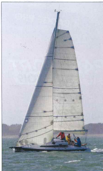
▲ Le bateau serait plus équilibré, plus facile à manier avec une grand-voile classique...

au détriment du confort. Exception faite de la présence de cale-pieds de bonne facture à l'aplomb du barreur. On ne s'attendait pas vraiment à autre chose au vu du programme qui attend ce petit Django virevoltant. Bien vus aussi les petits hublots encastrés dans le rouf à la sauce JPK qui assurent une bonne visibilité depuis l'intérieur. Une ergonomie de pont qui autorise également l'installation d'un rentreur 3D pour le réglage des écoutes de génois. Montage un tantinet complexe qui gagnerait à être simplifié... Le gréement « cathédrale » à un seul étage de barres de flèche poussantes avec bastaques de tête de mât associé à une GV à corne ne nous a en revanche pas emballés. Une configuration trop compliquée au moment de changer d'amure avec ces bastaques à mollir et à reprendre au vent. Mais aussi un surplus de puissance avec cette grand-voile à corne au centre vélique trop haut. Ce qui oblige à réduire rapidement si l'on ne peut pas mettre tout l'équipage au rappel. Rien à redire par contre au sujet du génois bien taillé avec présence de glissières pour prendre des ris si besoin. Précisons toutefois que la version Performance, une fois finalisée et exonérée des contraintes de l'IRC, proposera un mât en alu avec une GV classique. La delphinrière devrait aussi perdre